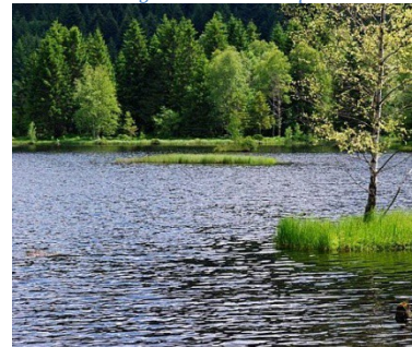
Lac de Lispach

Relâche obligatoire des carpes de + de 4 kg ou 60 cm