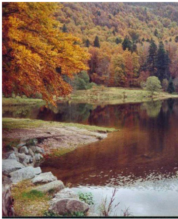
lac de Blanche